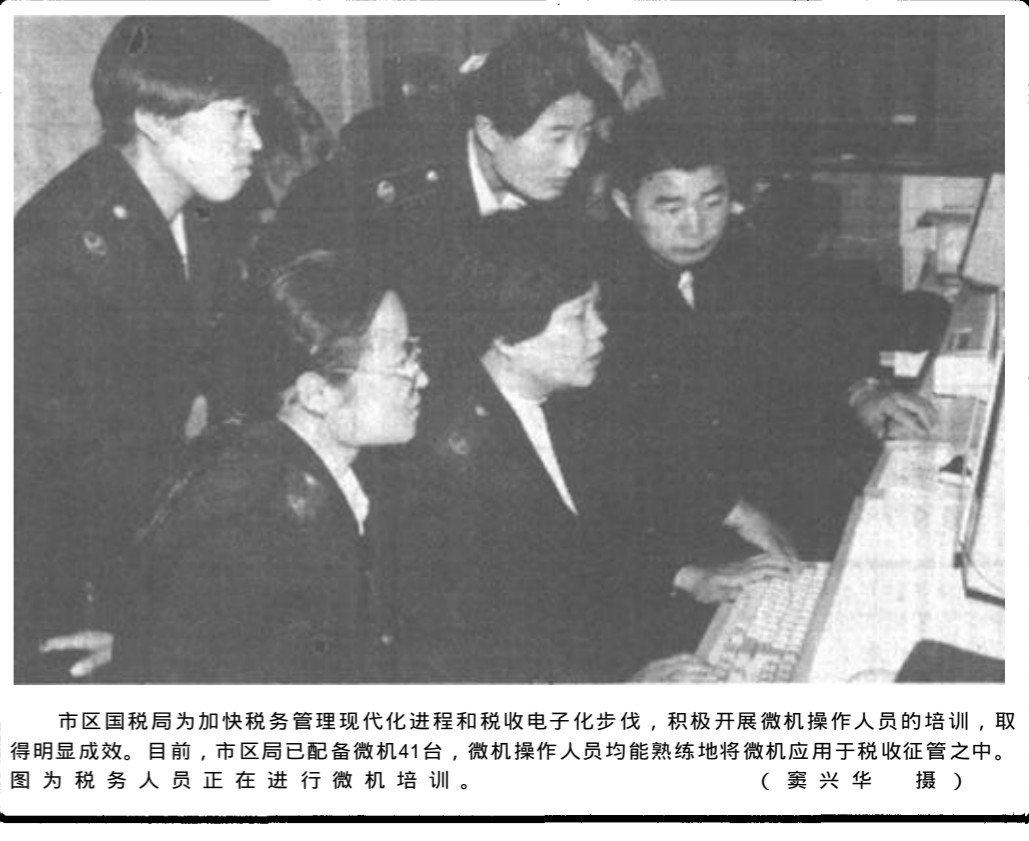
市区国税局为加快税务管理现代化进程和税收电子化步伐，积极开展微机操作人员的培训，取得明显成效。目前，市区局已配备微机41台，微机操作人员均能熟练地将微机应用于税收征管之中。图为税务人员正在进行微机培训。

之笔写，优点实在是太多了。我使用的WPS中文系统还有稿纸打印格式，打出来的稿子既整洁又漂亮，并且，用电脑写作，修改起来也方便，尚可随时存储，随时可以打印取用，惬意之极。目前我用电脑写作，不仅无干扰感和思绪之虞，相反成了一种酣畅淋漓的享受。 我想，我此生是注定与电脑须臾不可分离的了。因何？首先，“爬电脑”已成我终生嗜好；其次，电脑正在逐渐步入家庭，我计划搞一个家庭电脑多媒体。现在，我甚至打算建立家庭时不买彩电而买电脑。据说，电脑插入电视卡，就可当电视用的，若再买电视岂非重复投资？我庆幸我生长在一个电脑技术高度发达的时代，既然与电脑有缘，我会充分利用它并善待它。